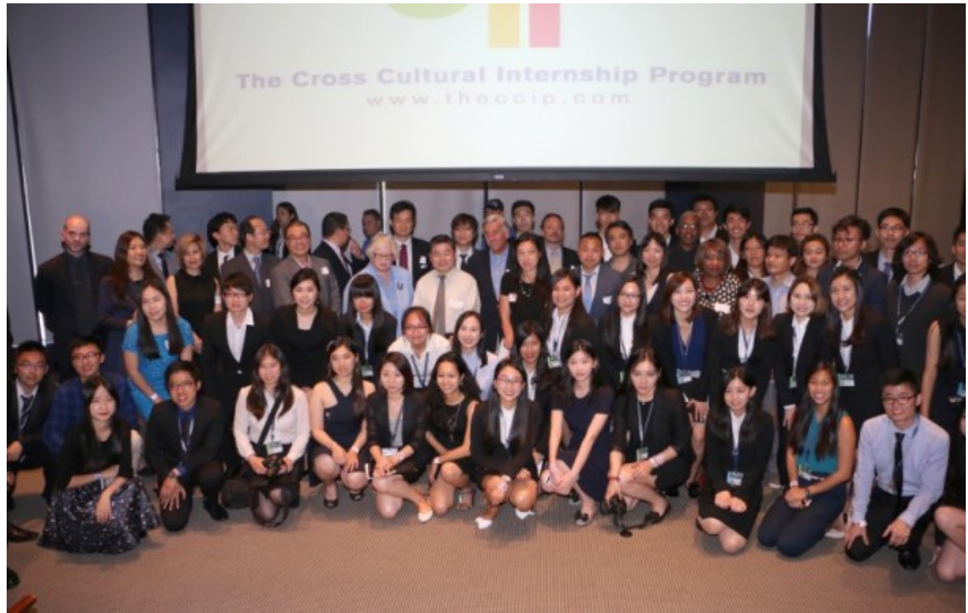
眾嘉賓與學生們在頒獎禮上合影。