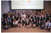
眾嘉賓與學生們在頒獎禮上合影。